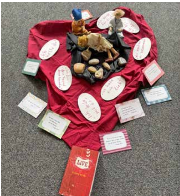
Text und Fotos: Anna Fendt

Zum Abschluss des gemeinsamen Tages waren alle Teilnehmer und deren Eltern und Geschwister zur Abschlussandacht in unsere Christuskirche eingeladen. Zusammen mit Pfarrer Florian Bach und Lektorin Heike Nachtmann wurden die geübten Lieder gesungen und gebetet und für den schönen Tag gedankt.