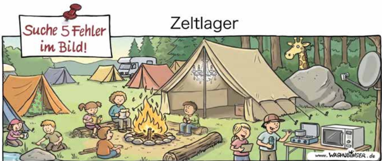
Tannenbaum, Kronleuchter, Giraffe, Mikrowelle, Satellitenschüssel